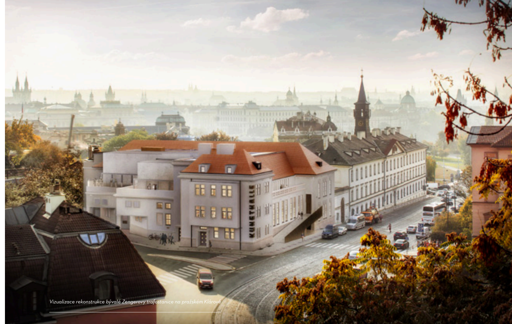
Vizualizace rekonstrukce bývalé Zengerovy trafostanice na pražském Klárově

Od počátku jsme zamýšleli výstavy jako výzkumné projekty. Je to však obdobné jako v akademickém prostředí. Nemůžeme dopředu jednoznačně vědět, kam