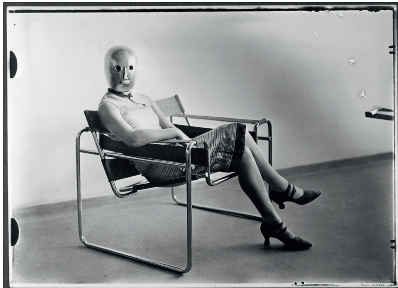
1/ dobové fotografie studentů před budovou Bauhausu, 1927, autor: T. Lux Feininger 2/ žena s divadelní maskou Oskara Schlemmera, sedící na křesle Marcela Breuera, 1926